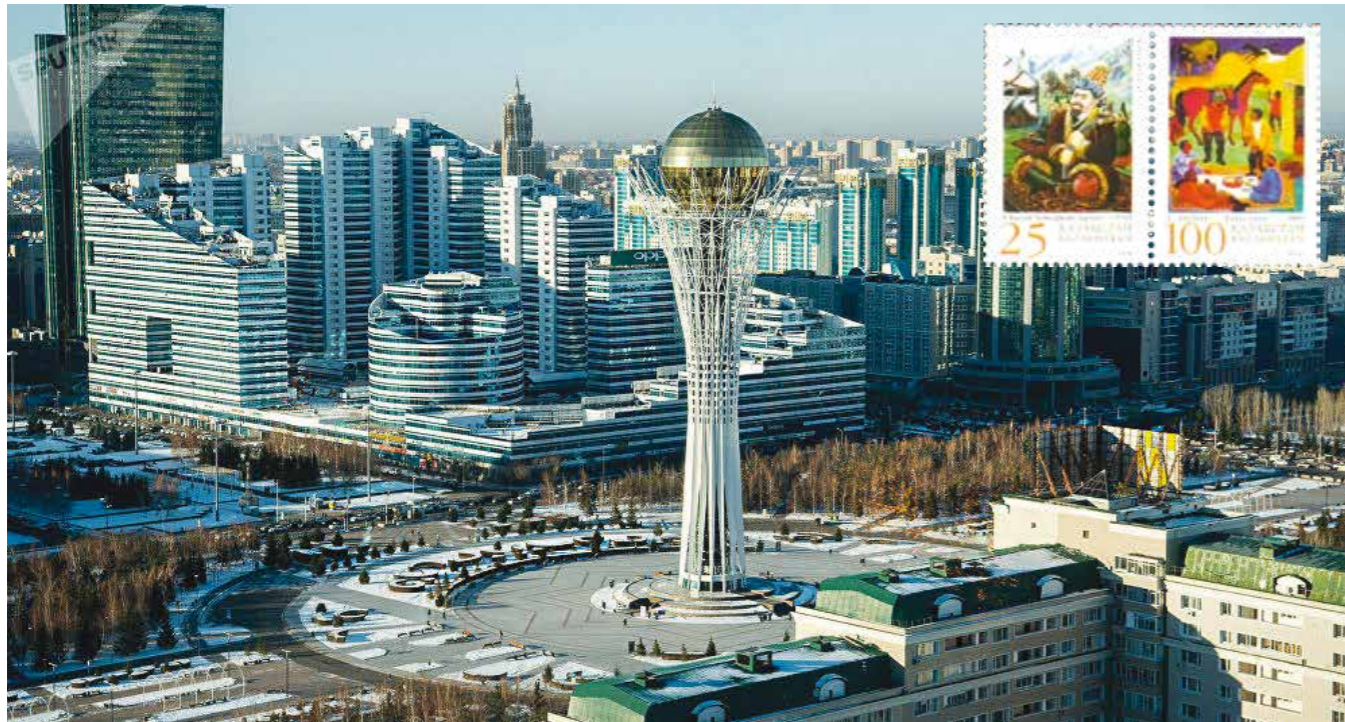
Astana, capitale du Kazakhstan