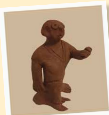
Arthur : 4 e rouge sculpture ; Révélation de l'année